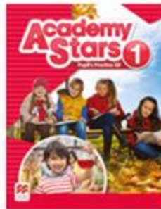
Pupil's Practice Kit